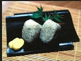
名物の鉱泉おにぎりも人気です。

黒豚／当温泉ではしゃぶしゃぶをはじめ黒豚を使った自慢の料理を御用意いたしております。ぜひともこの機会にご賞味くださいませ。(要予約)