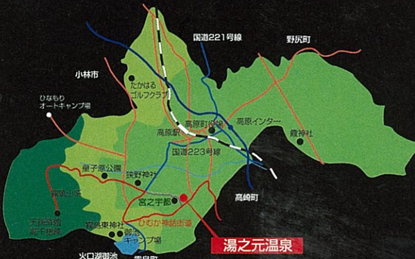
湯之元温泉の位置 The position of the Yunomoto hot spring